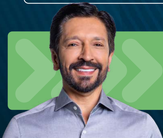
Ricardo Nunes PREFEITO DE SP

São obras, programas e projetos que valorizam a região, como as melhorias em 10 escolas e creches; e a recuperação estrutural do complexo viário Padre Adelino na região da avenida Salim Farah Maluf. Também a modernização de unidades de saúde: UBS VILA SANTO ESTEVÃO E AMA/UBS ÁGUA RASA , entre outras conquistas.