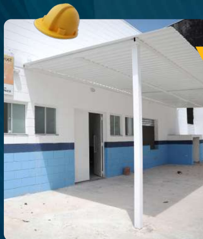
UBS Parque dos Búfalos

32 unidades habitacionais entregues na Vila Missionária. No total, serão 1.090 moradias.