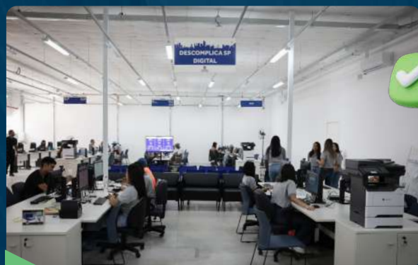
Novo Descomplica SP

São oferecidos 350 serviços públicos à população com 620 atendimentos diários.